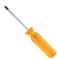
BD122 Klein Tools SCREWDRIVER PHILLIPS #2 8.5"