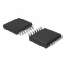
BD12734FV-GE2 Rohm Semiconductor IC OP AMP I/O FULL SWING 14SSOPB