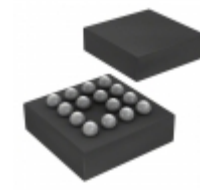
BD1206GUL-E2 Rohm Semiconductor IC LED DRIVER RGLTR DIM VCSP50L2