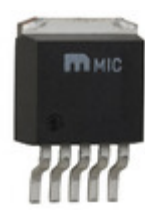
MIC39501-1.8BU Microchip Technology IC REG LDO 1.8V 5A TO263-5