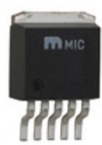
MIC39501-2.5BU TR Microchip Technology IC REG LDO 2.5V 5A TO263-5