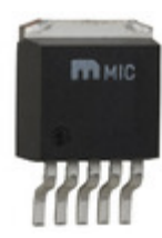
MIC39501-2.5BU Microchip Technology IC REG LDO 2.5V 5A TO263-5