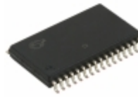
CY62148VNLL-70SXI Cypress Semiconductor Corp IC SRAM 4MBIT 70NS 32SOIC