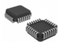
ATF20V8B-7JC Microchip Technology IC PLD 8MC 7.5NS 28PLCC