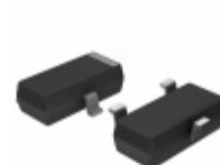
MIC803-26D3VM3-TR Microchip Technology IC MPU SUPERVISOR SOT-23-3