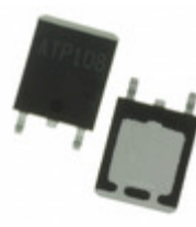
ATP304-TL-H ON Semiconductor MOSFET P-CH 60V 100A ATPAK