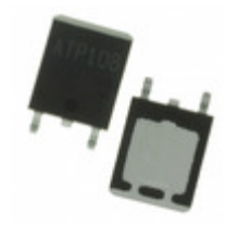
ATP301-TL-H ON Semiconductor MOSFET P-CH 100V 28A ATPAK