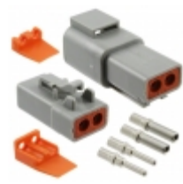
ATP2PS-CKIT Amphenol Sine Systems Corp ATP PIN & SOCKET WEDGE KIT