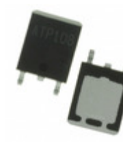
ATP302-TL-H ON Semiconductor MOSFET P-CH 60V 70A ATPAK