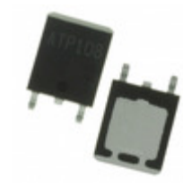
ATP404-TL-H ON Semiconductor MOSFET N-CH 60V 95A ATPAK