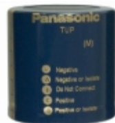
ECE-P2HP561HA Panasonic Electronic Components CAP ALUM 560UF 20% 500V SNAP