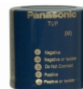
ECE-P2HP681HX Panasonic Electronic Components CAP ALUM 680UF 20% 500V SNAP