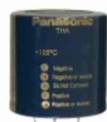
ECE-P2WA821HX Panasonic Electronic Components CAP ALUM 820UF 20% 450V SNAP