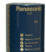
ECE-P2WP102HA Panasonic Electronic Components CAP ALUM 1000UF 20% 450V SNAP