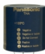
ECE-P2WA681HA Panasonic Electronic Components CAP ALUM 680UF 20% 450V SNAP