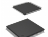
A42MX16-1VQG100I Microsemi Corporation IC FPGA 83 I/O 100VQFP