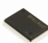
A42MX16-2PQ100 Microsemi Corporation IC FPGA 83 I/O 100QFP