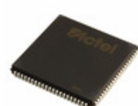
A42MX16-2PLG84I Microsemi Corporation IC FPGA 72 I/O 84PLCC