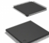
A42MX16-1VQ100M Microsemi Corporation IC FPGA 83 I/O 100VQFP