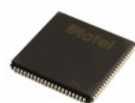
A42MX16-2PL84I Microsemi Corporation IC FPGA 72 I/O 84PLCC