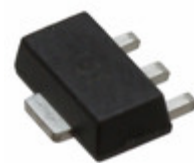
MGA-30689-TR1G Broadcom Limited IC GAIN BLOCK 40DBM LN SOT-89