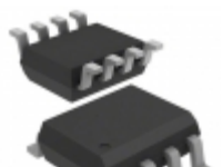
OP27GSZ-REEL7 Analog Devices Inc. IC OPAMP GP 8MHZ 8SOIC