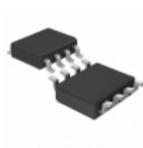
OP27GS8#PBF Linear Technology IC OPAMP GP 8MHZ 8SO