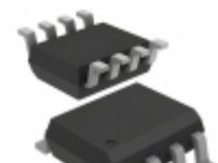
OP27GSZ-REEL Analog Devices Inc. IC OPAMP GP 8MHZ 8SOIC