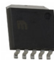
MIC37301-1.65BR TR Microchip Technology IC REG LDO 1.65V 3A SPAK-5