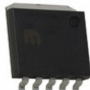
MIC37301-1.65BR Microchip Technology IC REG LDO 1.65V 3A SPAK-5