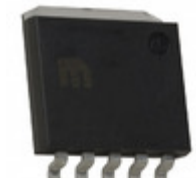
MIC37301-1.8BR Microchip Technology IC REG LDO 1.8V 3A SPAK-5