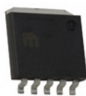
MIC37301-1.8WR-TR Microchip Technology IC REG LDO 1.8V 3A SPAK-5