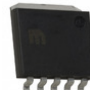
MIC37301-1.8WR Microchip Technology IC REG LDO 1.8V 3A SPAK-5