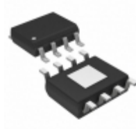
MIC37301-1.5YME-TR Microchip Technology IC REG LDO 1.5V 3A 8SOIC