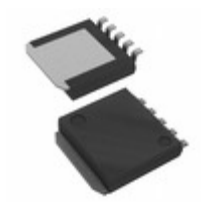
BD3572YHFP-MTR LAPIS Semiconductor IC REG LINEAR POS ADJ 500MA HRP5