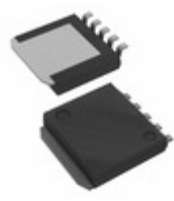
BD3570YHFP-MTR LAPIS Semiconductor IC REG LINEAR 3.3V 500MA HRP5