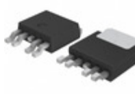
BD3572YFP-ME2 LAPIS Semiconductor IC REG LIN POS ADJ 500MA TO252-5