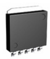
BD3571HFP-TR Rohm Semiconductor IC REG LDO 5V 0.5A HRP5