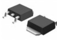
BD3571YFP-ME2 LAPIS Semiconductor IC REG LINEAR 5V 500MA TO252-3