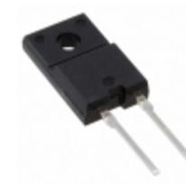
FMN-G14S SanKen Electric Co., Ltd. DIODE GEN PURP 400V 5A TO220F-2L