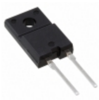
FMN-G12S SanKen Electric Co., Ltd. DIODE GEN PURP 200V 5A TO220F-2L