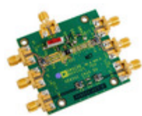
AD8351-EVALZ Analog Devices Inc. BOARD EVAL FOR AD8351