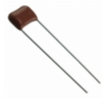
ECQ-E2223JF9 Panasonic Electronic Components CAP FILM 0.022UF 5% 250VDC RAD