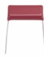
ECQ-E2185KS Panasonic Electronic Components CAP FILM 1.8UF 10% 250VDC RADIAL