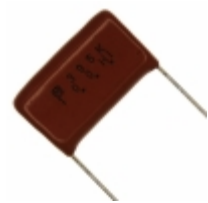
ECQ-E2185KFW Panasonic Electronic Components CAP FILM 1.8UF 10% 250VDC RADIAL