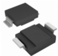
SMCG90CA-M3/9AT Electro-Films (EFI) / Vishay TVS DIODE 90V 146V DO215AB