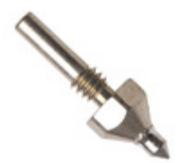
TC13 Apex Tool Group TIP SOLDER CONICAL 1/8" FOR C1C