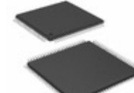
PIC18F97J94T-I/PF Microchip Technology IC MCU 8BIT 128KB FLASH 100TQFP