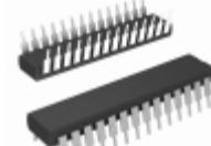
PIC18LC242-I/SP Microchip Technology IC MCU 8BIT 16KB OTP 28SDIP