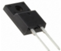
DHG10I1200PM IXYS DIODE GEN PURP 1.2KV 10A TO220FP