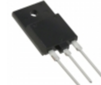
DHG20I1200HA IXYS DIODE GEN PURP 1.2KV 20A TO247