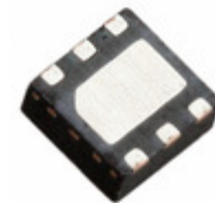
MCP4716A2T-E/MAY Microchip Technology IC DAC 10BIT NV EEP I2C 6DFN