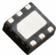
MCP4716A1T-E/MAY Microchip Technology IC DAC 10BIT NV EEP I2C 6DFN