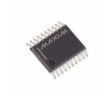
MAX4029EUP+ Maxim Integrated IC AMP VIDEO MUX 2:1 20-TSSOP