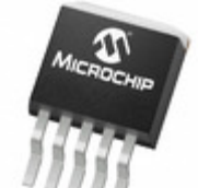
TC1265-2.5VETTR Microchip Technology IC REG LDO 2.5V 0.8A DDPK