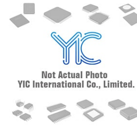
DTA014YEB TL ROHM DTA014YEB TL ROHM