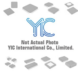
DTA014EV1 ROHM DTA014EV1 ROHM