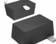
DTA014EUBTL Rohm Semiconductor TRANS PREBIAS PNP 50V 0.2W UMT3F