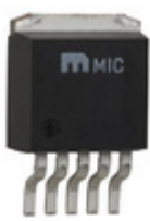
MIC39501-2.5BU TR Microchip Technology IC REG LDO 2.5V 5A TO263-5