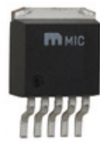
MIC39501-1.8BU Microchip Technology IC REG LDO 1.8V 5A TO263-5