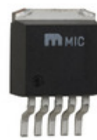
MIC39501-1.8WU-TR Microchip Technology IC REG LDO 1.8V 5A TO263-5