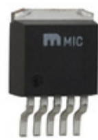
MIC39501-1.8BU TR Microchip Technology IC REG LDO 1.8V 5A TO263-5