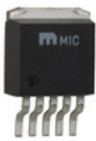
MIC39501-1.8WU Microchip Technology IC REG LDO 1.8V 5A TO263-5