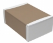
C4532C0G3F121K160KA TDK Corporation CAP CER 120PF 3KV C0G 1812