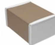
C4532C0G3F271K230KA TDK Corporation CAP CER 270PF 3KV C0G 1812