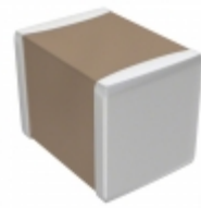
C4532C0G2W683K320KA TDK Corporation CAP CER 0.068UF 450V C0G 1812