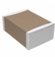
C4532C0G3F181K160KA TDK Corporation CAP CER 180PF 3KV C0G 1812