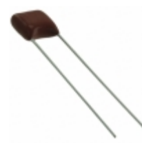
ECQ-E2153JB3 Panasonic Electronic Components CAP FILM 0.015UF 5% 250VDC RAD