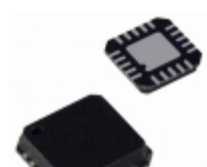
ADF4154BCPZ Analog Devices Inc. IC FRACTION-N FREQ SYNTH 20LFCSP