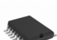
TC4627COE Microchip Technology IC MOSFET DRIVER 1.5A 16SOIC