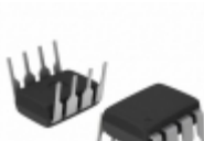
TC4626CPA Microchip Technology IC CMOS DRVR W/BOOST 1.5A 8-DIP