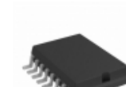
TC4626EOE Microchip Technology IC MOSFET DVR INV 1.5A 16SOIC