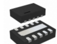
LTC4224CDDDB-2#TRMPBF Linear Technology IC CNTRLR HOT SWAP DUAL 10-DFN