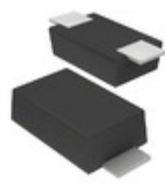
KDZLVTFTR120 Rohm Semiconductor DIODE ZENER 120V 1W SOD123FL