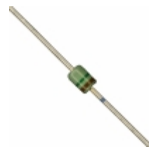
MAZ41500MF Panasonic Electronic Components DIODE ZENER 15V 370MW DO34