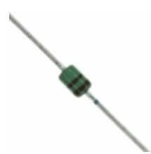
MAZ41100MF Panasonic Electronic Components DIODE ZENER 11V 370MW DO34