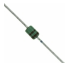
MAZ41100MF Panasonic Electronic Components DIODE ZENER 11V 370MW DO34