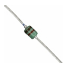
MAZ41200MF Panasonic Electronic Components DIODE ZENER 12V 370MW DO34