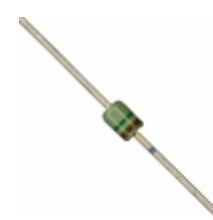
MAZ41500MF Panasonic Electronic Components DIODE ZENER 15V 370MW DO34