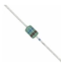
MAZ41600MF Panasonic Electronic Components DIODE ZENER 16V 370MW DO34