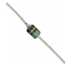
MAZ41200MF Panasonic Electronic Components DIODE ZENER 12V 370MW DO34