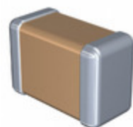
C1206C224K5RECAUTO KEMET CAP CER 1206 220NF 50V X7R 10%