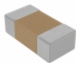
C1206C224K8JAC7800 KEMET CAP CER 0.22UF 10V U2J 1206