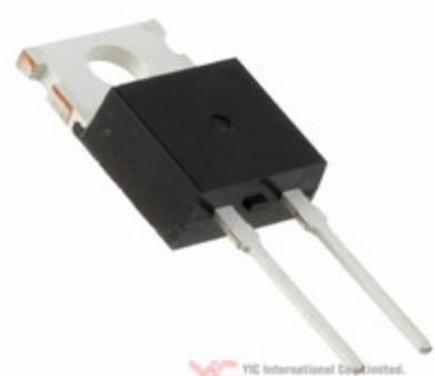
Image may be representation. See specs for product details.