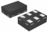
74AUP2G0604GMH Nexperia USA Inc. IC INVERTER/BUFFER LP OD 6XSON