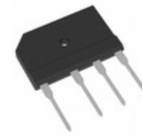
TS25P01GHD2G TSC (Taiwan Semiconductor) BRIDGE RECT 1PHASE 50V 25A TS-6P