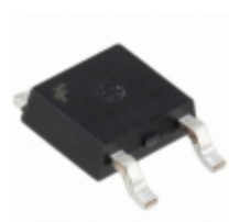
FDD86380_F085 Fairchild/ON Semiconductor MOSFET N-CH 80V 50A DPAK