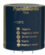
ECE-T2DA222EA Panasonic Electronic Components CAP ALUM 2200UF 20% 200V SNAP