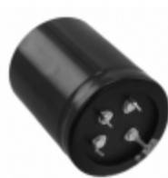
ECE-T2DA272FA Panasonic Electronic Components CAP ALUM 2700UF 20% 200V SNAP