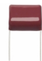
ECW-F2185JB Panasonic Electronic Components CAP FILM 1.8UF 5% 250VDC RADIAL