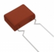
ECW-F2224RJA Panasonic Electronic Components CAP FILM 0.22UF 5% 250VDC RADIAL