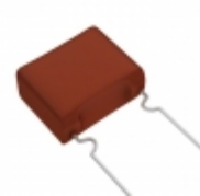
ECW-F2185RJA Panasonic Electronic Components CAP FILM 1.8UF 5% 250VDC RADIAL