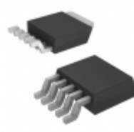
AP1118D33L-13 Diodes Incorporated IC REG LDO 3.3V 1A TO252-5