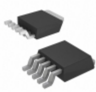
AP1118D15L-13 Diodes Incorporated IC REG LDO 1.5V 1A TO252-5