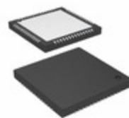
CY8CTST120-56LTXIT Cypress Semiconductor IC TRUETOUCH CAPSENSE 56VQFN