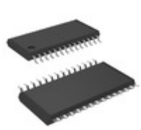
AT97SC3204-X1A190 Microchip Technology IC CRYPTO TPM LPC 28TSSOP