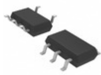
LTC6101HVAIS5#TRMPBF Linear Technology IC OPAMP CURR SENSE TSOT23- 5