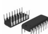
DG444DJ Electro-Films (EFI) / Vishay IC SWITCH QUAD SPST 16DIP