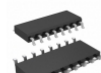
DG444CY+T Maxim Integrated IC SWITCH QUAD SPST 16SOIC