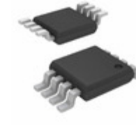
MIC384-3BMM-TR Microchip Technology SENSOR TEMP I2C/SMBUS 8MSOP