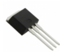
IRFSL11N50A Electro-Films (EFI) / Vishay MOSFET N-CH 500V 11A TO-262