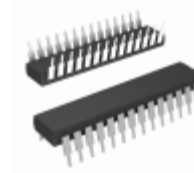
MCP23016-I/SP Microchip Technology IC I/O EXPANDER I2C 16B 28SDIP