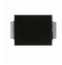
CSFB205-G Comchip Technology DIODE GEN PURP 600V 2A DO214AA