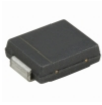
CSFC301-G Comchip Technology DIODE GEN PURP 50V 3A DO214AB