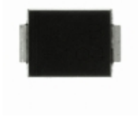
CSFB203-G Comchip Technology DIODE GEN PURP 200V 2A DO214AA