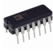
AD585AQ ADI (Analog Devices, Inc.) IC OPAMP SAMPLE HOLD 2MHZ 14CDIP