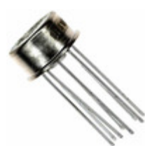
AD584TH ADI (Analog Devices, Inc.) IC VREF SERIES PROG TO99-8