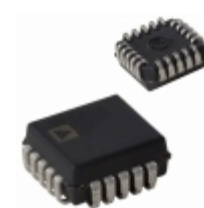
AD585JP ADI (Analog Devices, Inc.) IC OPAMP SAMPLE HOLD 2MHZ 20PLCC