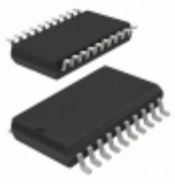
SY100EL38ZC-TR Microchip Technology IC CLK GEN /2 /4/6 5/3.3V 20SOIC