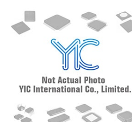
AD831AP-REEL AD AD PLCC20