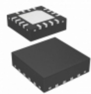
AD8318ACPZ-R2 Analog Devices Inc. IC RF DETECTOR/CTRLR 16- LFCSP